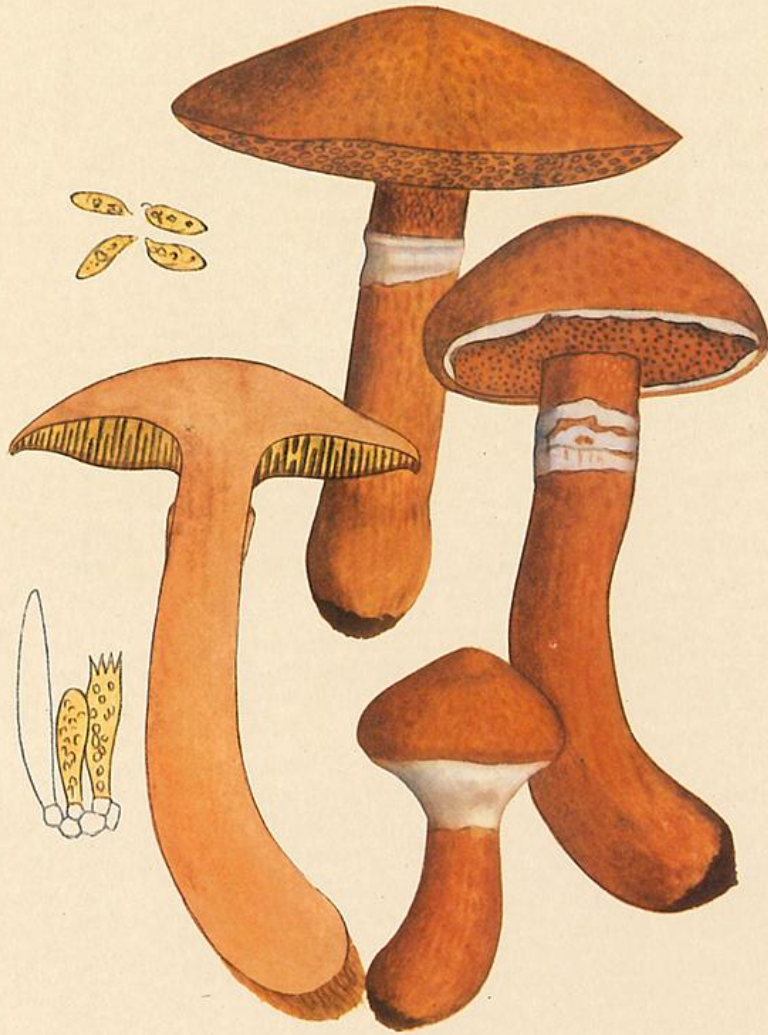
Boletus tridentinus Bres.